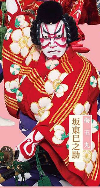
梅王丸 坂東巳之助